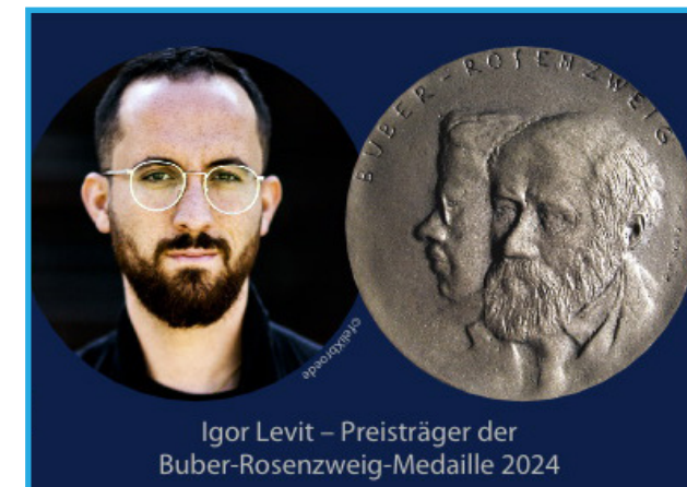
Igor Levit – Preisträger der Buber-Rosenzweig-Medaille 2024