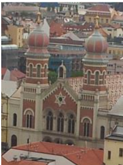
Synagoge in Pilsen

An die Gesellschaft für Christlich-Jüdische Zusammenarbeit in Düsseldorf e.V. Bastionstr. 6 40213 Düsseldorf